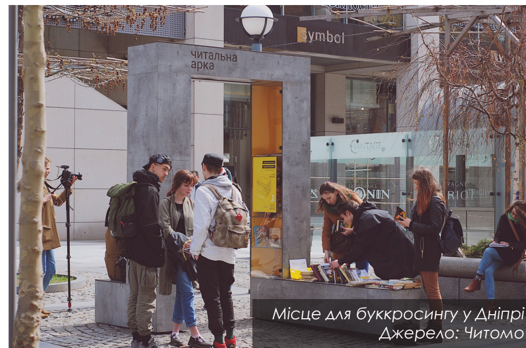
Місце для букросингу у Дніпрі