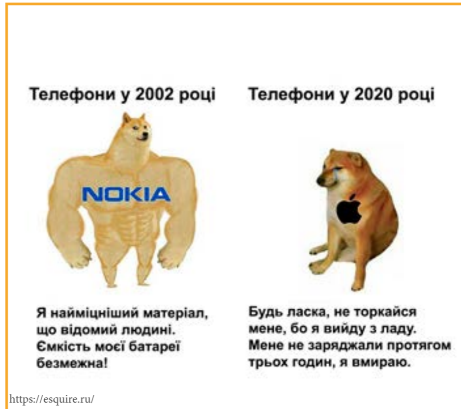
Телефони у 2002 році Я найміцніший матеріал, що відомий людині. Ємкість моєї батареї безмежна!