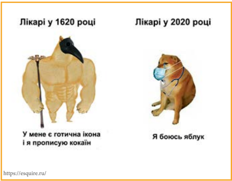
Лікарі у 1620 році У мене є готична ікона і я прописую кокаїн