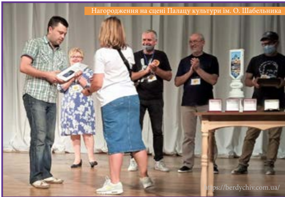
Нагородження на сцені Палацу культури ім. О. Шабельника