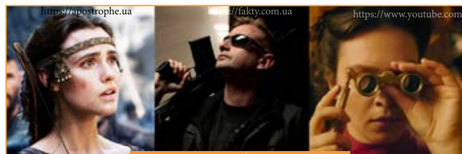
кадри із фільмів

Справді, кількість українських фільмів упродовж десятих років неухильно зростала. Якщо у 2013 році було знято тільки дванадцять фільмів, то у 2018 їхня кількість збільшилася втричі й сягнула тридцяти п'ятьох! І справа не в тому, що зростає цікавість до творів Шевченка чи Франка — справа в тому, що зростає цікавість до української культури як такої, її історії, мови, традицій