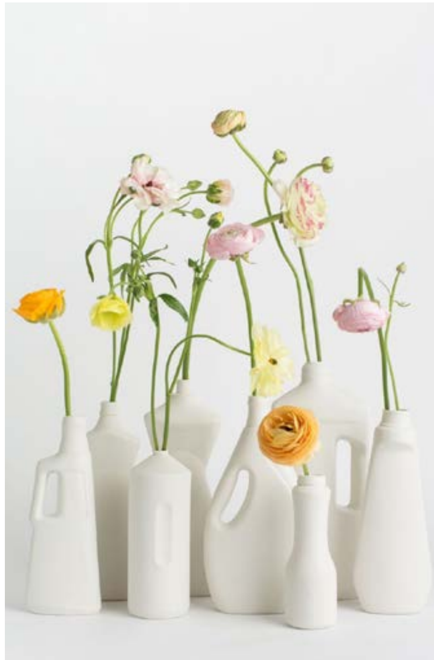
Приклад повторного використання пластикових пляшок

кілля. І це найвагоміший чинник. Хіба це не чудово, що сміття рятує від звалищ та дають йому нове життя?