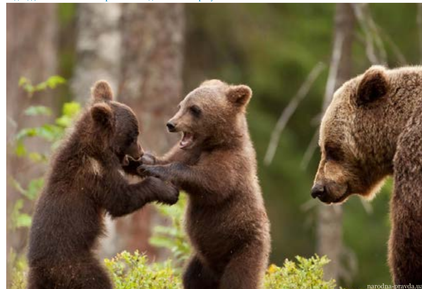
Ведмеді, які мешкають на теренах заповідника із 2020 року

Відповідно, на таких величезних масивах живе значна кількість організмів. Флора налічує 1396 видів рослин, 120 лишайників та 20 різновидів моху. Фауна ж також вражає: 300 видів хребетних тварин, серед яких трапляються вовки, лосі, козулі, бурі ведмеді та навіть рисі.