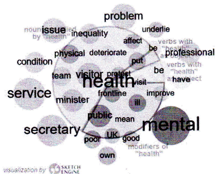
Рис. 1. Діаграма словосполучень із HEALTH у The Guardian

Таким чином, можна виокремити чотири групи словосполучень: