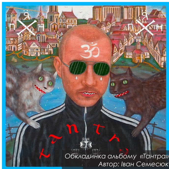
Обкладинка альбому «Тантра» Автор: Іван Семесюк

Наступною стала балада «Родіна», чий спокійні гітара та флейта вводять у певний транс. Занурившись у свій ритм, ця пісня шукає відповідь на давнє совкове питання: «З чого починається Родіна?». Але знаходить