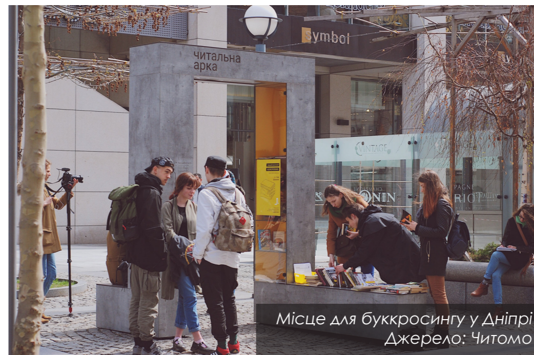
Місце для букросингу у Дніпрі